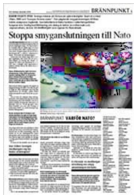
Uppropet i Svenska Dagbladet

Den fråga som borde vara självklar är: Med tanke på den stora och bestående folkopinionen emot Nato-anslutning samt att endast ett av sju riksdagspartier öppet förespråkar fullt medlemskap, hur har det över huvud taget varit möjligt att Sverige i så hög grad redan befinner sig inlindat i Nato?